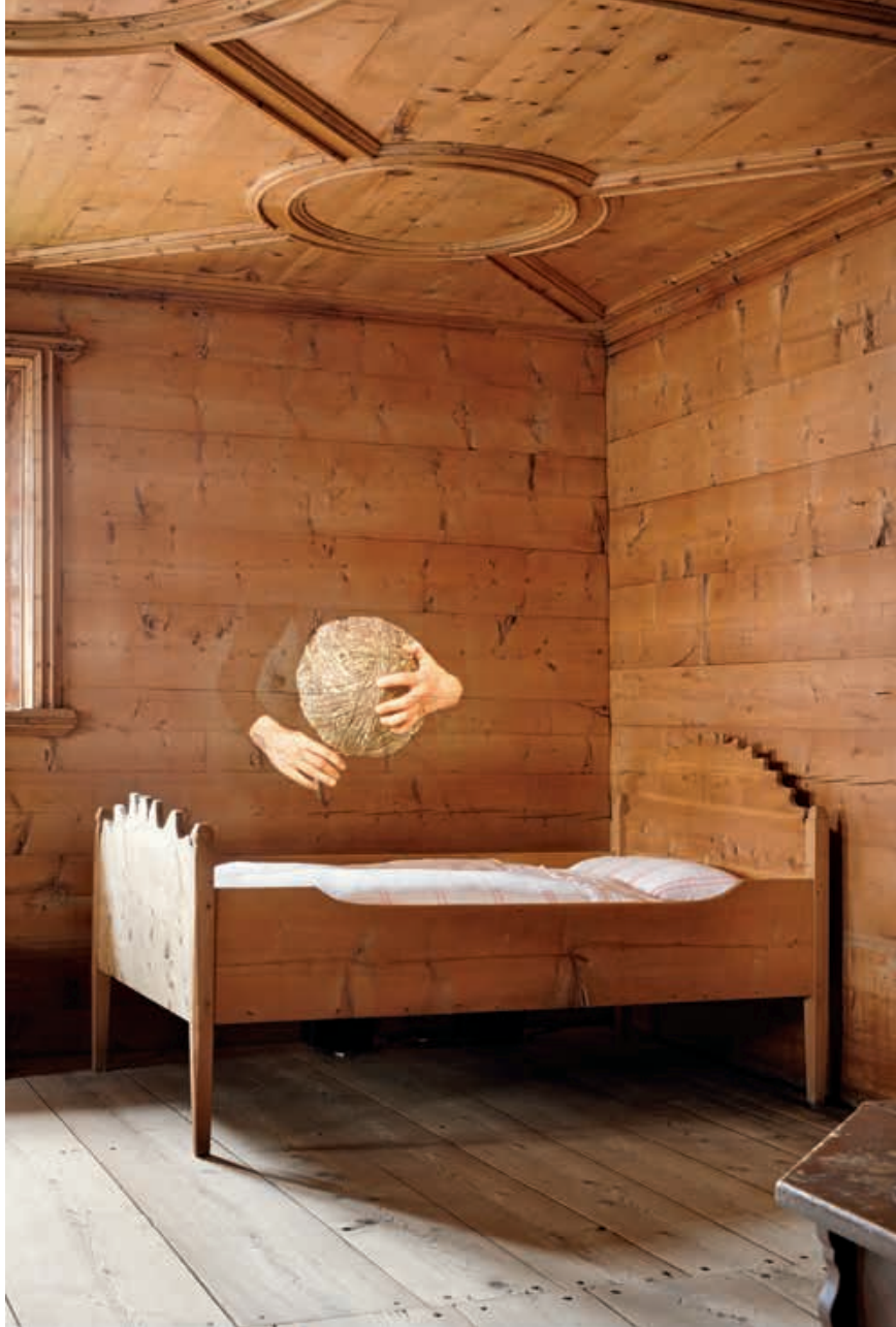
Video Arte Palazzo Castelmur 2013, Evelina Cajacob, Incrésciar – LangeZeit . HD-Videoinstallation. Bild: Margarit Lehmann, Ton: Martin Hofstetter.

dem Thema der Land and Environmental Art widmete. Alle zwei Jahre sollen nun Ausstellung und Akademie mit wechselndem thematischem Schwerpunkt im Safiental verankert werden. Im Sommer 2018 wird die Art Safiental zum zweiten Mal stattfinden.