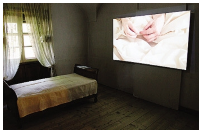
Video e installazioni negli antichi palazzi